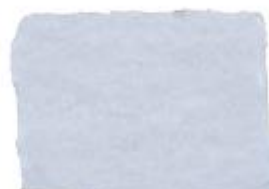
BIANCO REALE 010