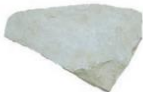
PIETRA DI TRANI 011