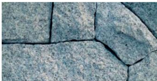
Nome: granito pepe sale