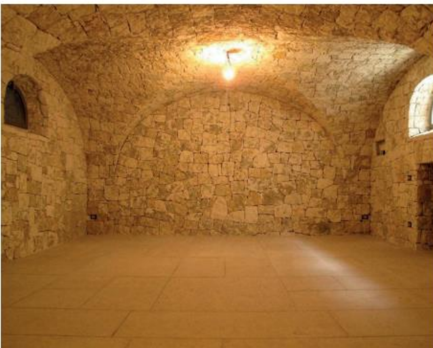
Opera incerta giallo e credaro posato a secco con sistema dell'artigliatura