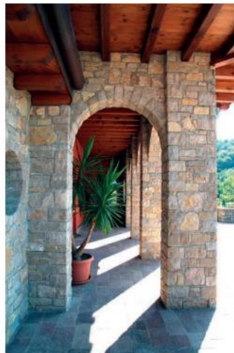
Opera o corso di di pietra di Credano di forma regolare con teste a spacco