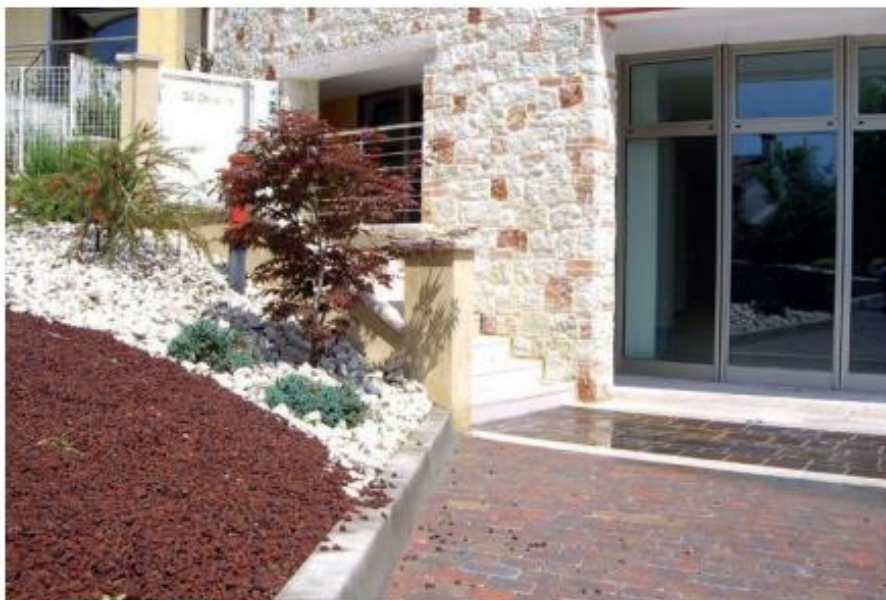
Opera mista Rosso asiago e Biancone con mattoncini, Forma regolare lati a spacco e fuga