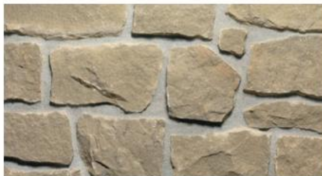
Tipo: pietra di credano Posa: opera incerta