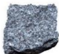
GRANITO SALE E PEPE 008