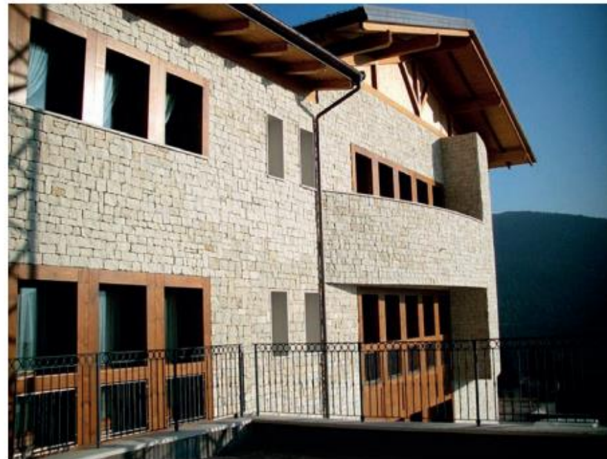
Opera a corso regolare di Biancone a coste a spacco posata a secco lavorato a mano