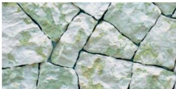
Nome: biancone asiago