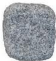
GRANITO PEPE SALE