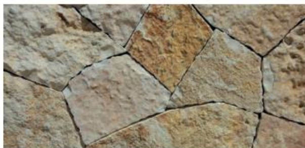
Tipo: pietra di Trani