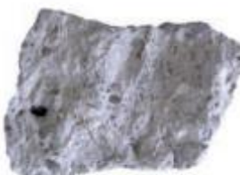
CEPPO DI GRE 012