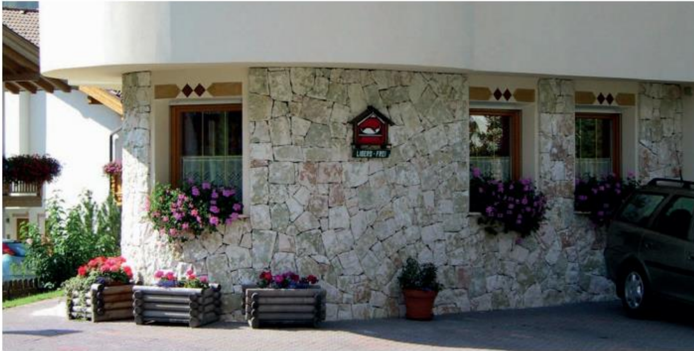
Opera incerta di Biancone posata a secco