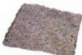
GRANITO ROSA 007