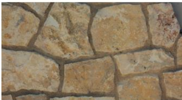
Tipo: giallo reale Posa: opera incerta