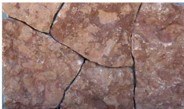
Nome: rosso asiago