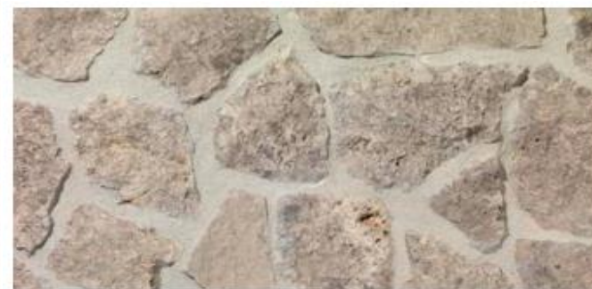
Tipo: grigio dolomitico Posa: opera incerta