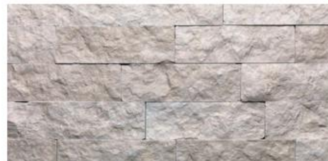
Nome: bianco Reale Posa: opera a corso