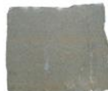
PIETRA DI CREDARO 009