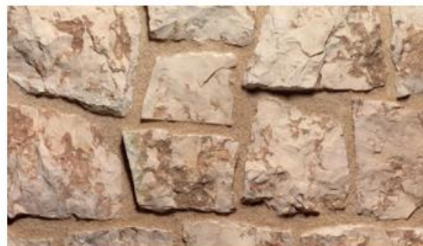
Nome: rosa asiago