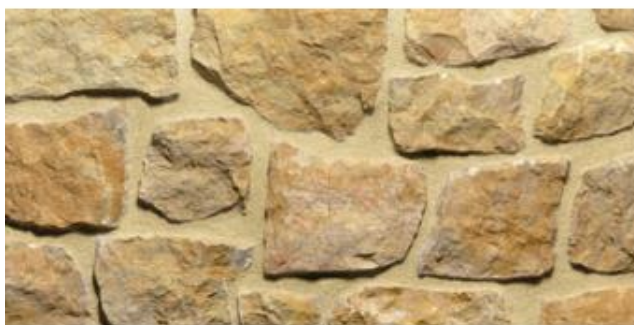
Tipo: pietra di trani Posa: opera incerta