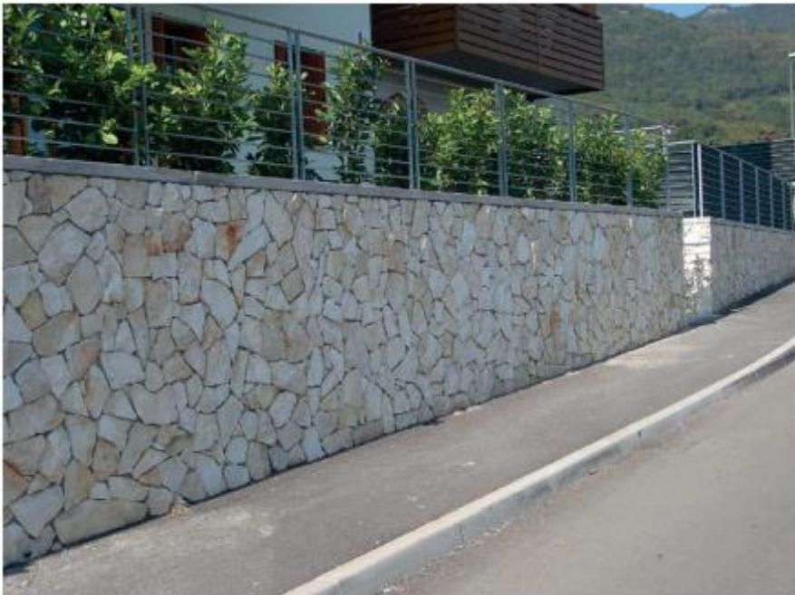
Opera incera pietra di Trani