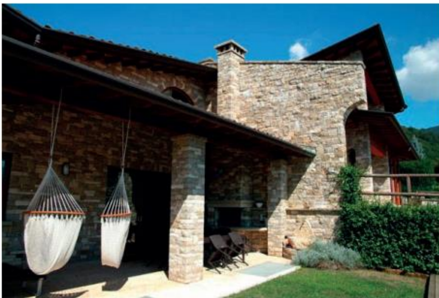
Opera incerta a coste spacco posata a secco