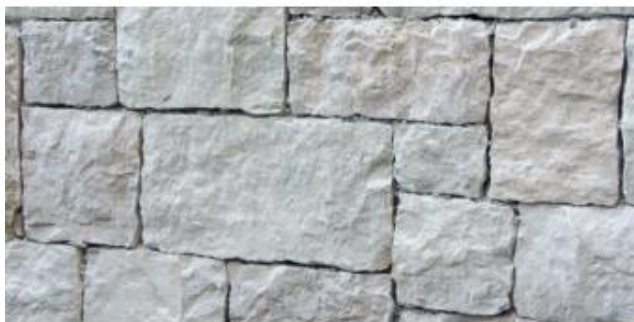
Tipo: bianco Asiago Posa: opera regolare lavorata